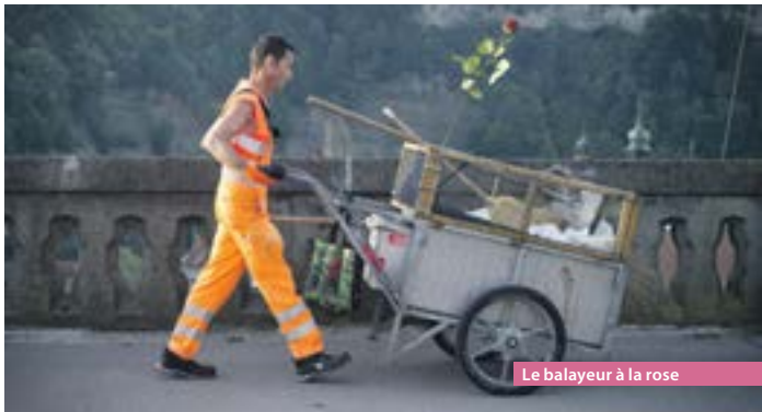
Le balayeur à la rose

Prix Farel 2016; Sélection officielle Vision du Réel 2016