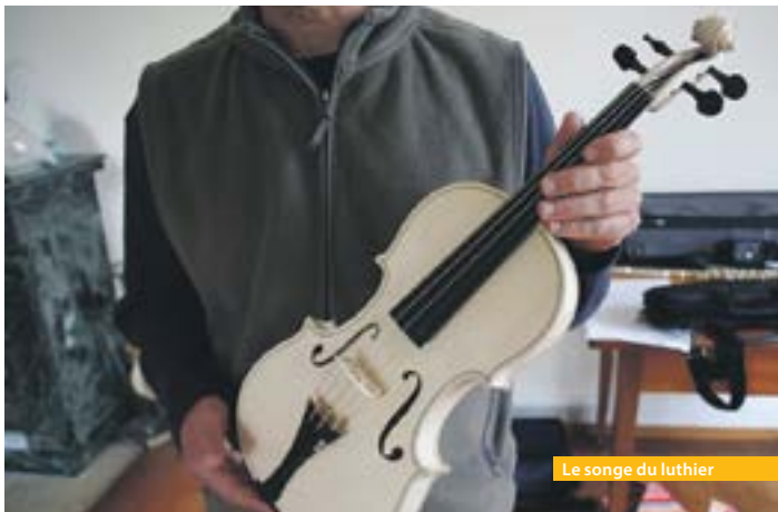
Le songe du luthier

En présence du réalisateur Christophe Ferrux