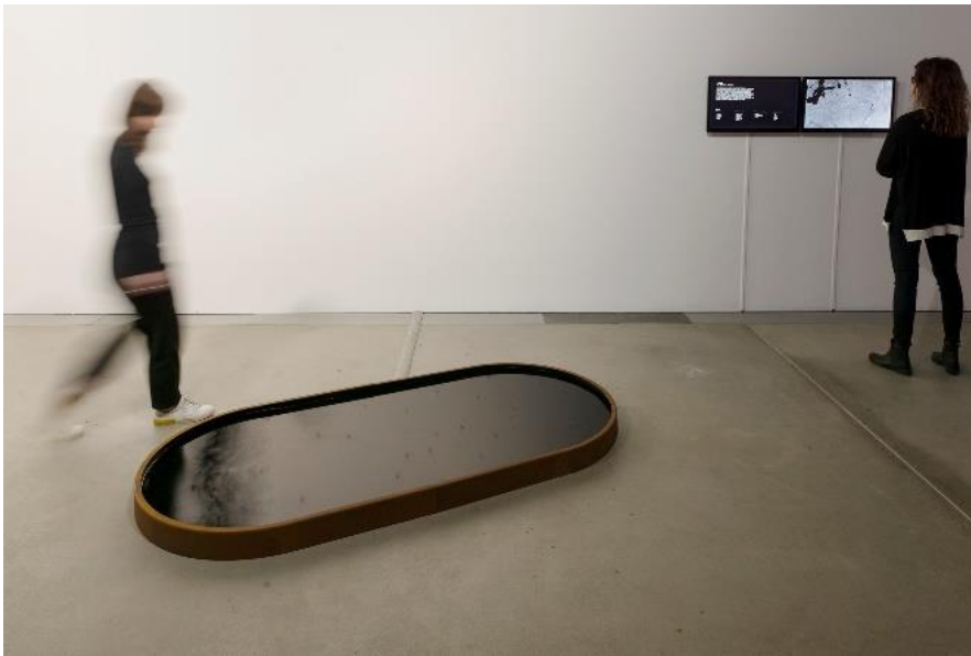
Fragmentin, Displuvium, 205 x 100 x 15 cm, 2 screens, weathering steel, black aluminium, 3D printed nozzles, water pumps, electronic components, computer. Développé en collaboration avec le designer Renaud Defrancesco.

L'installation est composée d'un bassin d'eau et de deux écrans. Le visiteur observe des gouttes de pluie tomber dans le bassin en motifs tantôt aléatoires – comme on a l'habitude de le voir – tantôt parfaitement géométriques, symbolisant les précipitations manipulées par l'être humain. Le public est-il capable de percevoir la transformation graduelle du rythme de la pluie ? A quel moment une pluie semblant naturelle se révèle-t-elle comme une averse créée et contrôlée artificiellement ? Cette "pluie programmée" dérange par son artifice mais surprend aussi par son étrange beauté et son aspect méditatif.