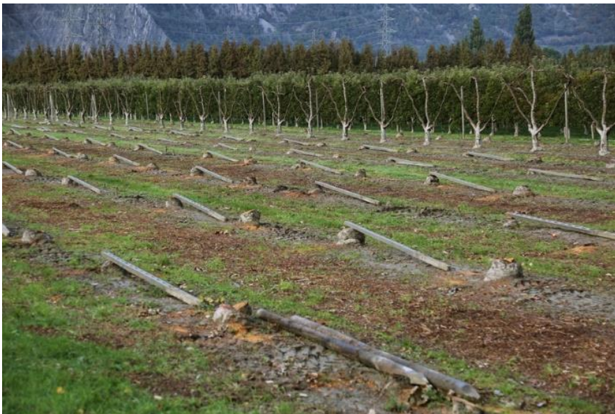
Maximilien Urfer, Agrisculpture , 2021

Avec cette nouvelle étape, celle du projet vidéo, l'artiste questionne avant tout la question du regard. Il construit une narration selon diverses façons de regarder la plaine et ces sculptures d'un genre particulier.