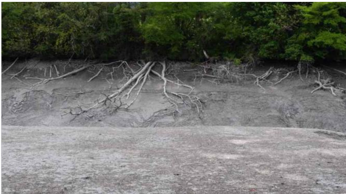
Marie Velardi & Jérôme Leuba, Still de Rhône / Territoires mouvants , 2022

Que retrouve-t-on de nos corps dans le fleuve ? Comment l'eau du fleuve / du lac se retrouve en nous ? Quelles traces de nos activités se retrouvent dans le fleuve ? Qui dépend du fleuve ? Quelles autres espèces ? Gardons-nous une mémoire (collective) des crues ? Que nous rappelons-nous de l'ancien cours du Rhône ? Faut-il le corriger ou lui laisser plus de place ? Le maîtriser ou vivre avec l'incertain ? Comment protéger cette entité ?