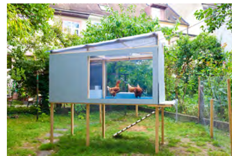
De Ovo (De Novo) , 2016, Installation, 3 Hühner, Hühnerstall, Hühnerfutter, Computer-Tastatur, Laptop, Grösse variabel

Das Künstlerduo Badel/Sarbach arbeitet seit 2014 zusammen und konnte bereits an zahlreichen Ausstellungen und Projekten auf sich aufmerksam machen. Augenfällig sind dabei die Themen, welche stets eine andere Erscheinungsform und Bildsprache einnehmen und sich im Interesse des Künstlerpaars gefestigt haben. Badel/Sarbach untersuchen immer wieder Schnittstellen der Gesellschaft und deren Kultur, so bringen sie zum Beispiel das Huhn mit einer Computertastatur zusammen ( De Ovo (De Novo) , Installation, 2016) und ermöglichen neue, eigenwillige Sichtweisen. Die Werke von Badel/Sarbach sind auf mehreren Ebenen lesbar, es bieten sich vielschichtige Objekte, Installationen, Performances oder Fotoarbeiten einer Interpretation dar, welche sowohl aus dem eigenen Kontext wie auch durch Recherche entsteht.