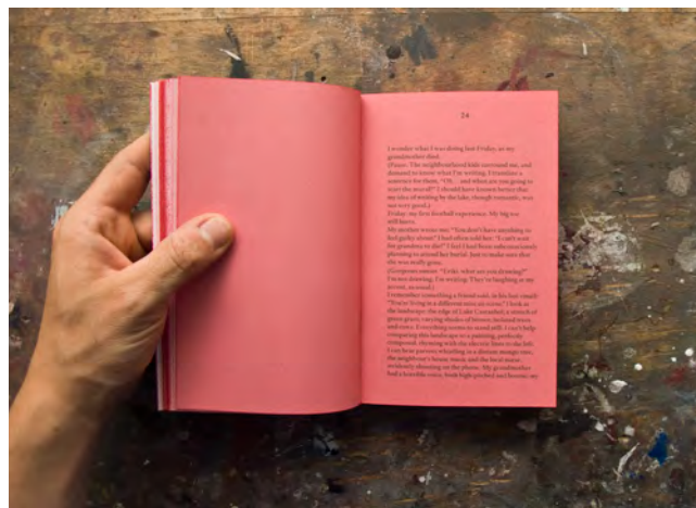
Livret de service, 2012, publication (français/anglais), 126 pages, 11x16.5x2cm., 250 copies