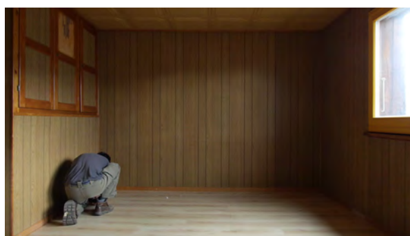
Présence #66 (Salon, 29.07.2013), 2015, vidéo HD