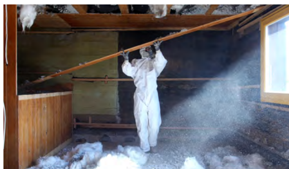
Présence #70 (Salon, 07.09.2013), 2015, vidéo HD

Pages suivantes: Mon Amour (Désolé pour les carrelages) , 2015, texte et performance