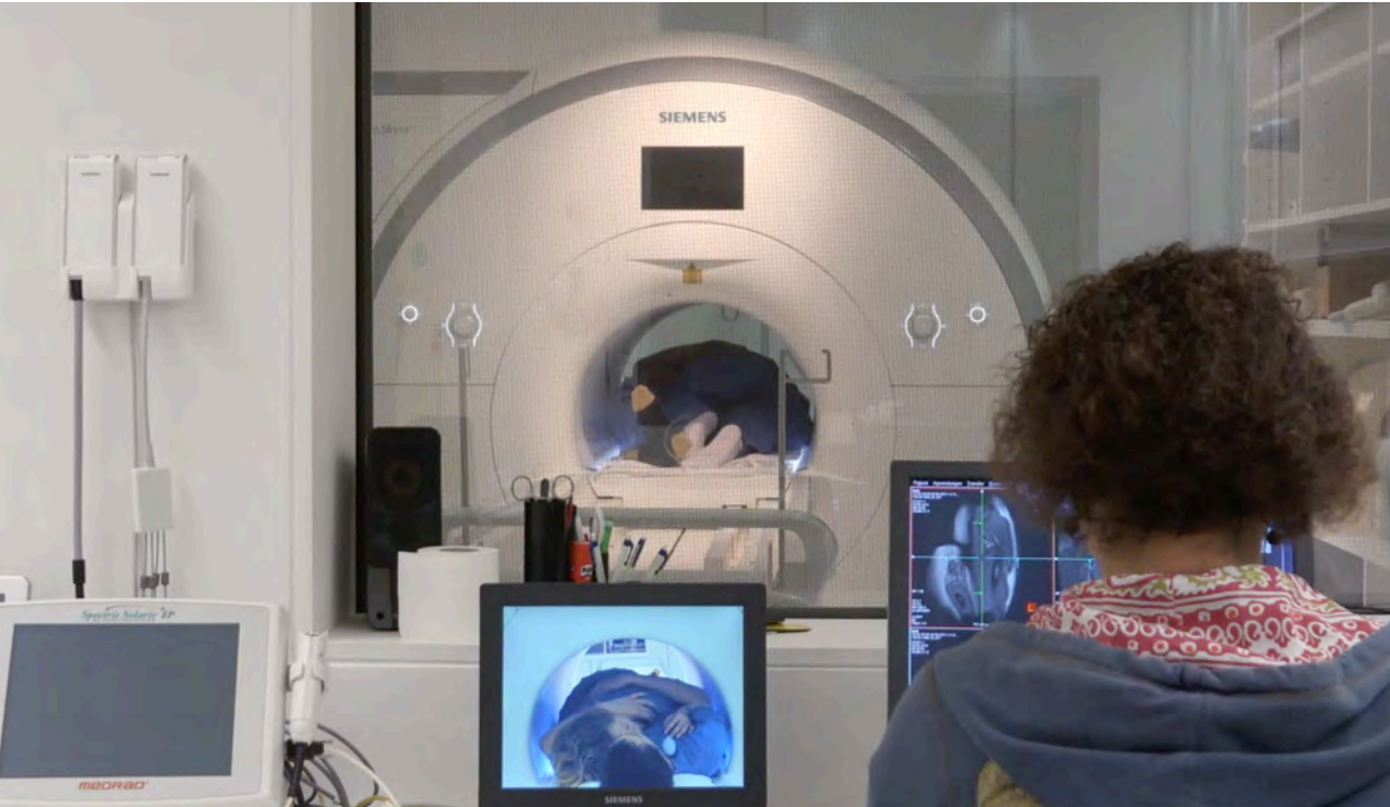
Videostill aus der Installation im Basler Münster, Lithified Glow II (Our Bedroom) , 2015, Foto: Badel/Sarbach